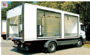
Rys. 1.6 Samochody ciężarowe [110], [259] a – skrzyniowy IVECO, b – skrzyniowy (z żaluzjami) DAF