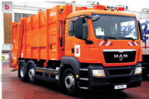
Rys. 1.8 Samochody specjalne [229], [260] a – pożarniczy Sutphen, b – śmieciarka MAN