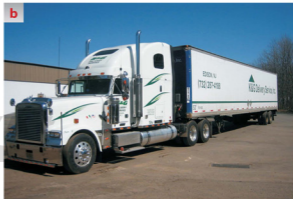
Rys. 1.9 Ciągniki siodłowe [172], [237] a – bez naczepy, b – z naczepą