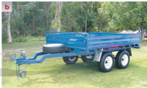
Rys. 1.12 Przyczepy [134], [212] a – kempingowa, b – ciężarowa