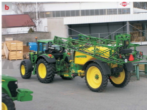
Rys. 1.11 Ciągniki rolnicze John Deere