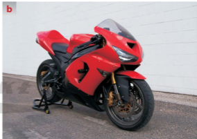
Rys. 1.5 Motocykle [167], [234] a – enduro (do jazdy w terenie) Kawasaki, b – sportowy Kawasaki