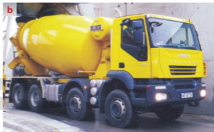
Rys. 1.7 Samochody ciężarowe specjalizowane [111] a – samowyladowczy Kenworth, b – betnomieszarka IVECO