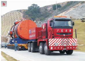
Rys. 1.10 Ciągniki balastowe Nicolas Tractomas ze specjalnymi przyczepami do przewozu ładunków ponadgabarytowych [217]